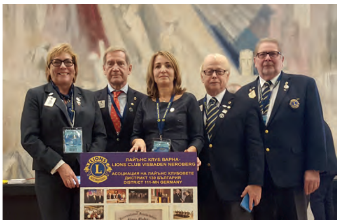
20 Jahre Freundschaft mit dem Multidistrikt 130 - Bulgarien

Die Aktivitäten zum 100jährigen Lionsjubiläum mit den Centennial-Zielen Jugend, Sight First, Umwelt und Hunger werden weit mehr als 100 Mio. Menschen benötigte Hilfe bringen und mit den "Legacy-Projekten" Erinnerungen an unsere Hilfeleistungen in den Kommunen bleibend dokumentieren.