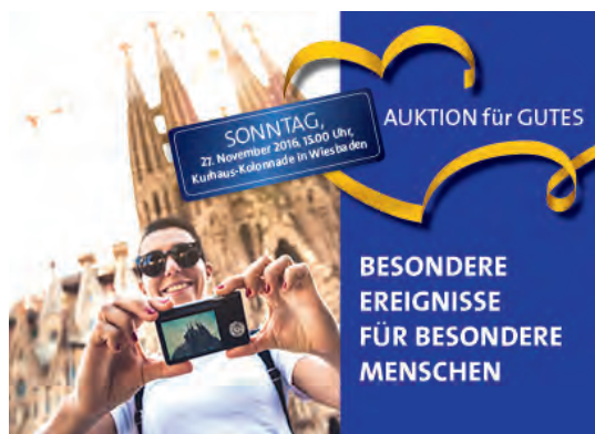
Der Lions Club Wiesbaden lädt zur „Auktion für Gutes“ nach Wiesbaden ein.

In Zusammenarbeit mit vielen Partnern und Spendern aus der Region können auch dieses Jahr wieder mehr als 55 „Besondere Geschenke für besondere Menschen“ ersteigert werden. Von einem Abenteuerurlaub in Südafrika über Erlebnis-Wochenenden in edlen Luxuskarossen, Hubschrauberflügen und VIP-Tickets ist der Angebotskorb prall gefüllt (Katalog siehe www.auktion-fuer-gutes.de ). Es lohnt sich also, am 27. November 2016 (1. Advent) um 15.00 Uhr in der Kurhaus-Kolonnade dabei zu sein.