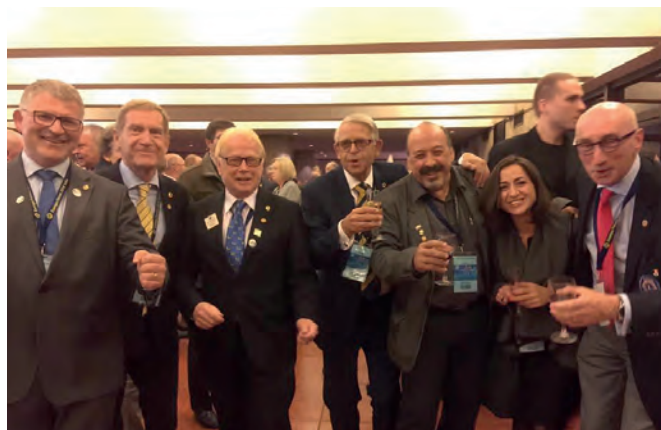
Viel Freude in Sofia