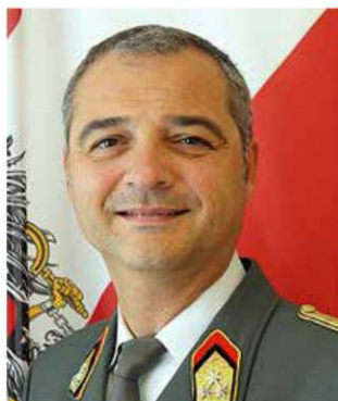
Mag. Wolfgang Spalj, Oberst des Generalstabsdienstes des österreichischen Bundesheeres; österreichischer Verbindungsoffizier zum Einsatzführungskommando der Bundeswehr in Potsdam

A nlässlich des 60-jährigen Bestehens des LC Wien (Host) ist es mir eine große Freude und Ehre, einen Beitrag für die vorliegende Festschrift verfassen zu dürfen. Unter dem Motto „We serve!“ möchte ich vielleicht einen anderen Blickwinkel darauf werfen. Aufgrund meines Berufs als Generalstabsoffizier des österreichischen Bundesheeres bin ich auch immer wieder nicht im Inland tätig.